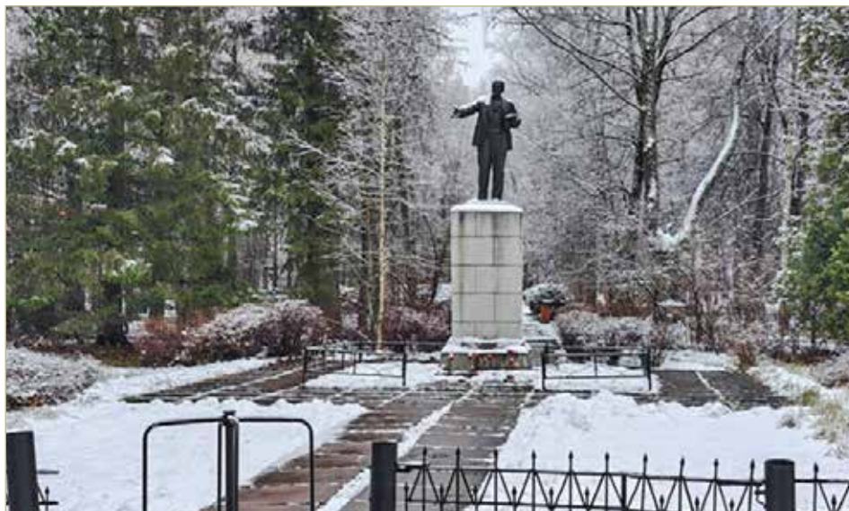
Ещё одна часть городского парка в Холме ждёт своего благоустройства.

В 2021 году Холм уже одержал победу во всероссийском конкурсе, которая позволила в следующем году привести в порядок значительную часть парка. Город получил на работы 63,44 млн рублей из федерального бюджета и 6 млн — из областного и местного.