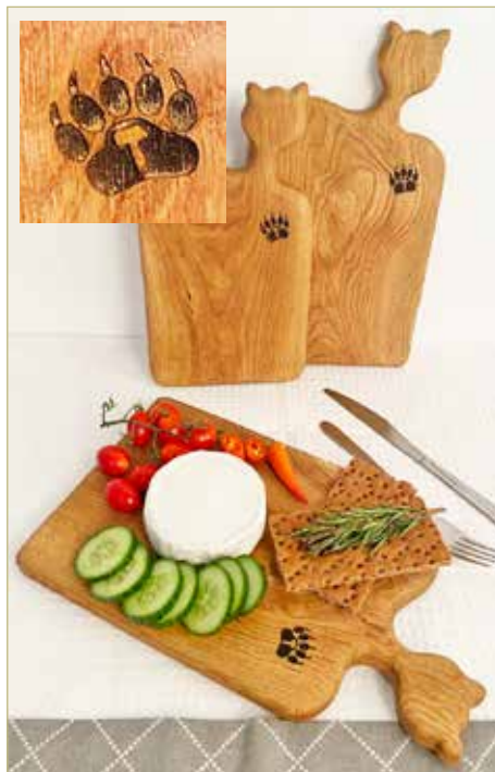
Нет-нет, это не реклама ИП Сухиненко. Хотя знаете, скоро Новый год...

ляных рудниках. И я горжусь этим. А в 2014 году Донбасс поднялся, чтобы сказать на весь мир: «Мы русские! И готовы за это сражаться». По факту СВО — это Отечественная война. Мы воюем за право быть самими собой. Хотя мы не остаёмся немецкие танки на Волоколамском шоссе, и вот здесь, на Волхове, не стоят пулемётные гнёзда.