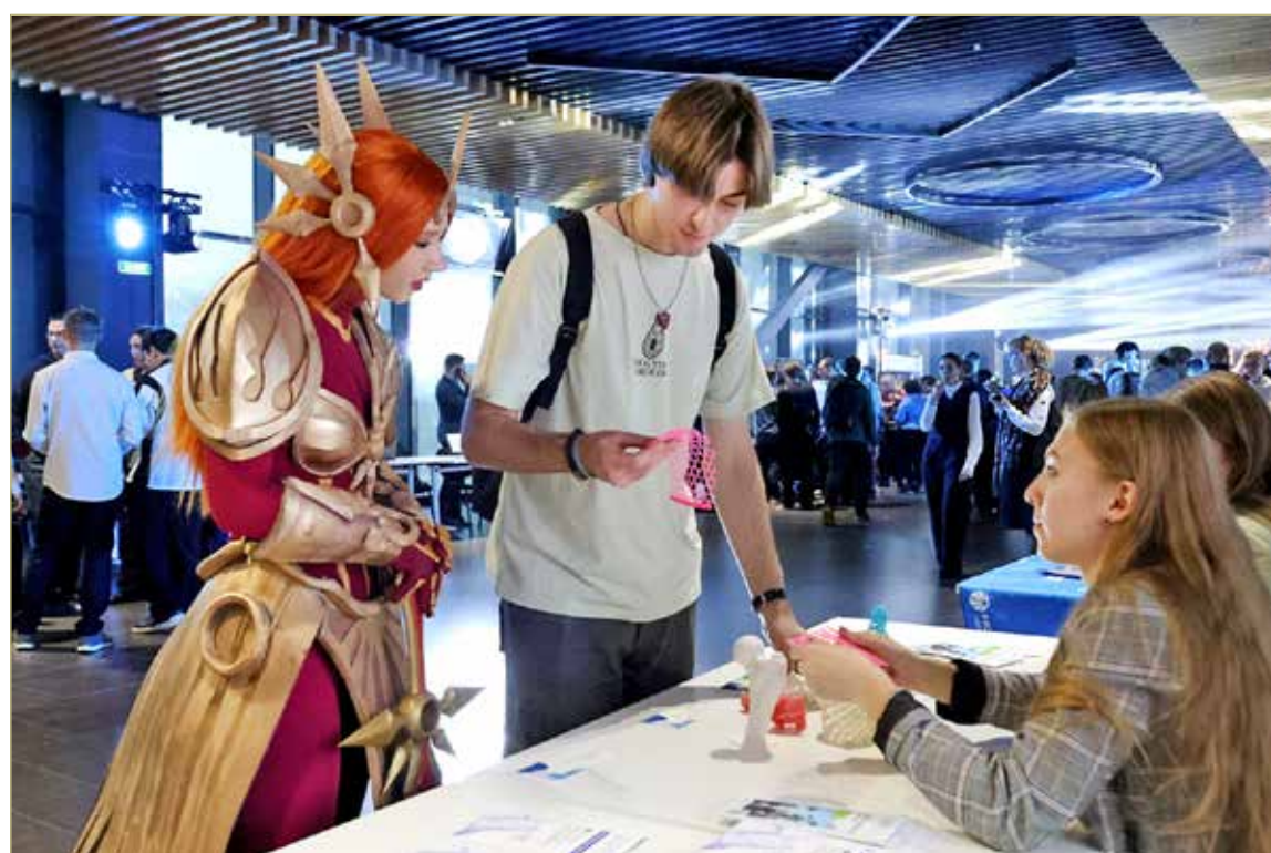
Ядром фестиваля стала масштабная интерактивная выставка.

ПОТЕНЦИАЛЬНЫХ ИНЖЕНЕРОВ В ВЕЛИКОМ НОВГОРОДЕ СОБРАЛ ФЕСТИВАЛЬ ПЕРЕДОВОЙ ИНЖЕНЕРНОЙ ШКОЛЫ