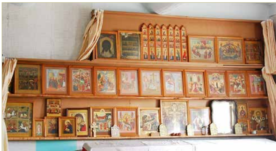
Иконостас моленной в обычном доме.