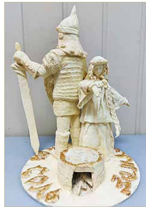
Работа «Соль земли русской» из Старой Руссы передана в дар московскому Музею ватной игрушки.

Свою первую работу, Деда Мороза, она до сих пор хранит. Серьёзно относит-