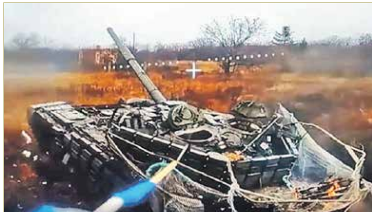
Атака российским дроном-камикадзе украинского танка на подступах к Красноармейску. Именно так оператор дрона и видит цель. Через мгновение связь оборвётся – будет взрыв.