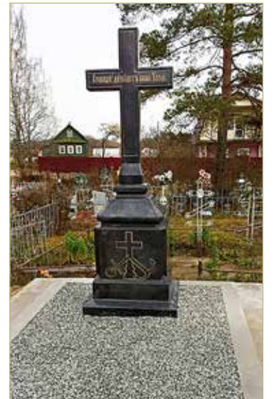
Два года назад надгробный памятник Михаилу Тиролю был отреставрирован.

А в январе 1863 года его назначили начальником Северной