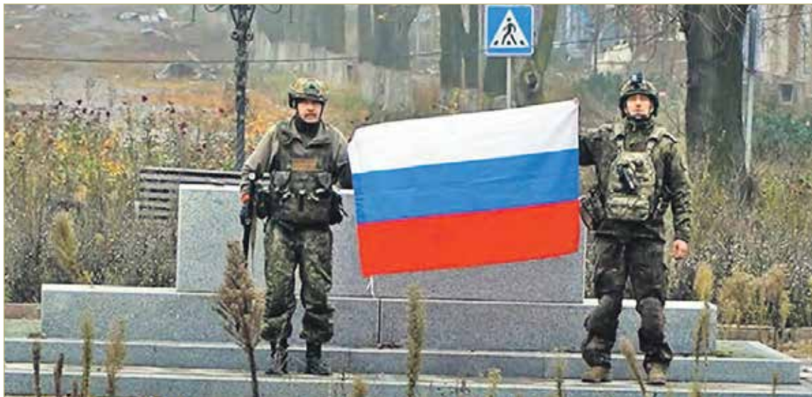
Штурмовик «Шум» (на фото – он справа) признался «КП», что самым трудным было просочиться в Покровск. А когда врага выбили – можно и флаг водрузить.

– Заходили три-четыре дня, в дождь и туман, нас вели «птицами». Когда добрались до самого города, было облегчение – в городе много укрытий.