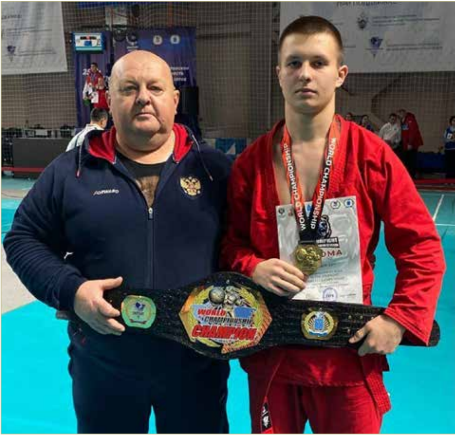
Лев Трофимов вместе с тренером Сергеем Чертолиным после победы на первенстве мира.

Этот вид спорта, выросший из русского рукопашного боя, едва ли кого-то заставит скучать. Он подобрал в себя множество других дисциплин — от спортивной гимнастики до лёгкой атлетики. Прежде чем выйти на ринг, спортсмены должны преодолеть полосу препятствий, в том числе, например, пробежать по гимнастическому бревну, выстрелить из пистолета в цель, мет-